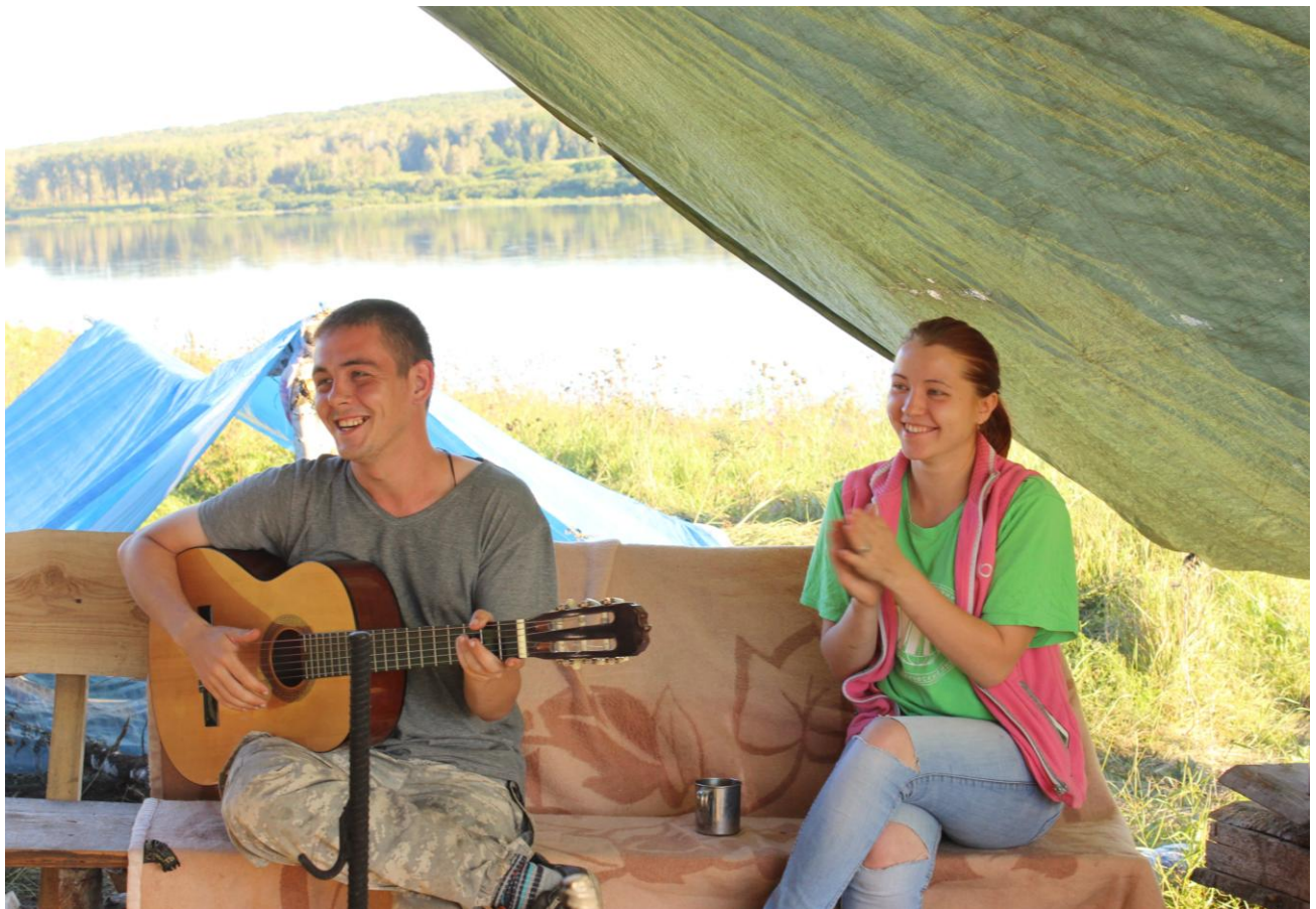
Вечернее время у костра