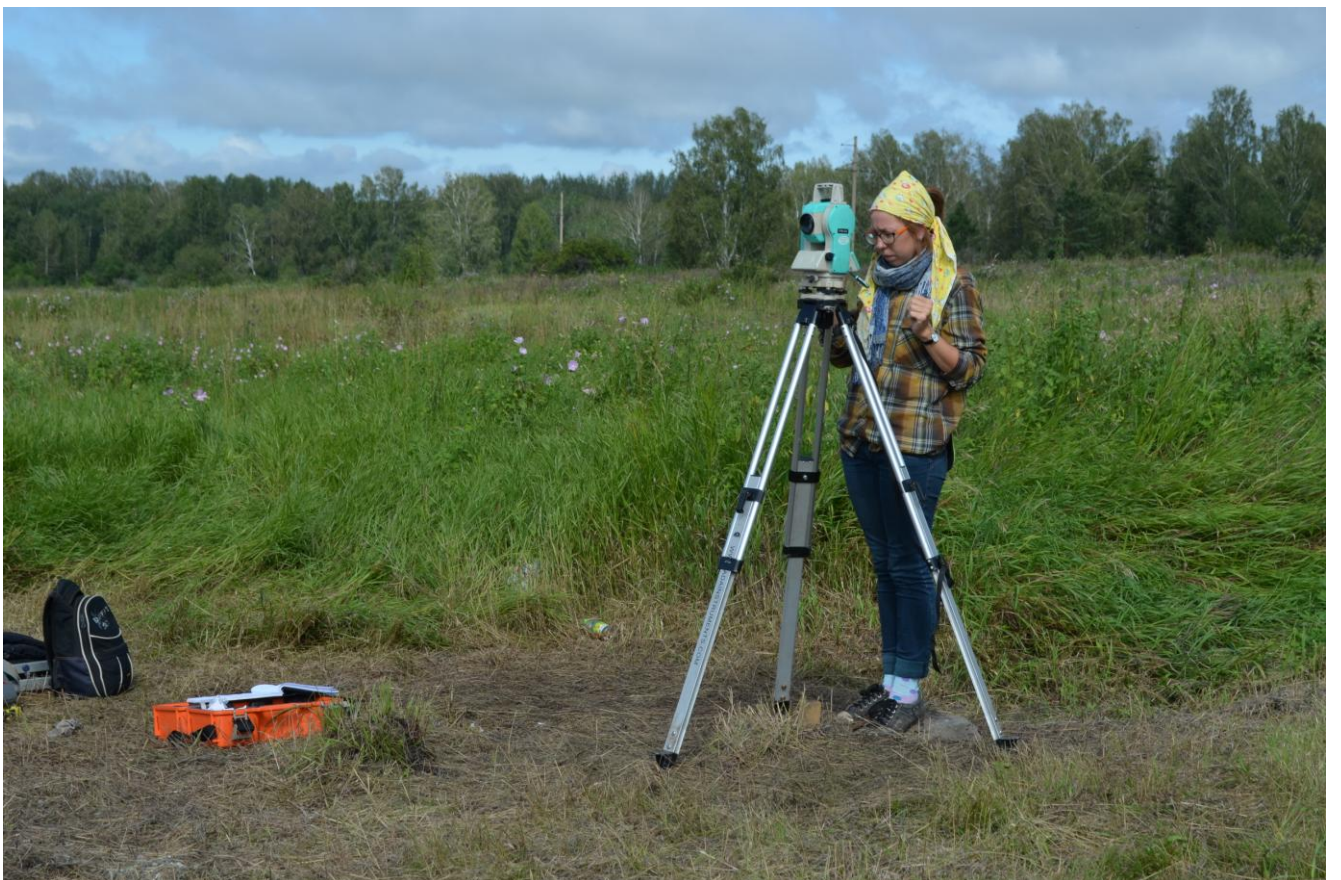
Тахеометрическая съемка зафиксированных находок и объектов