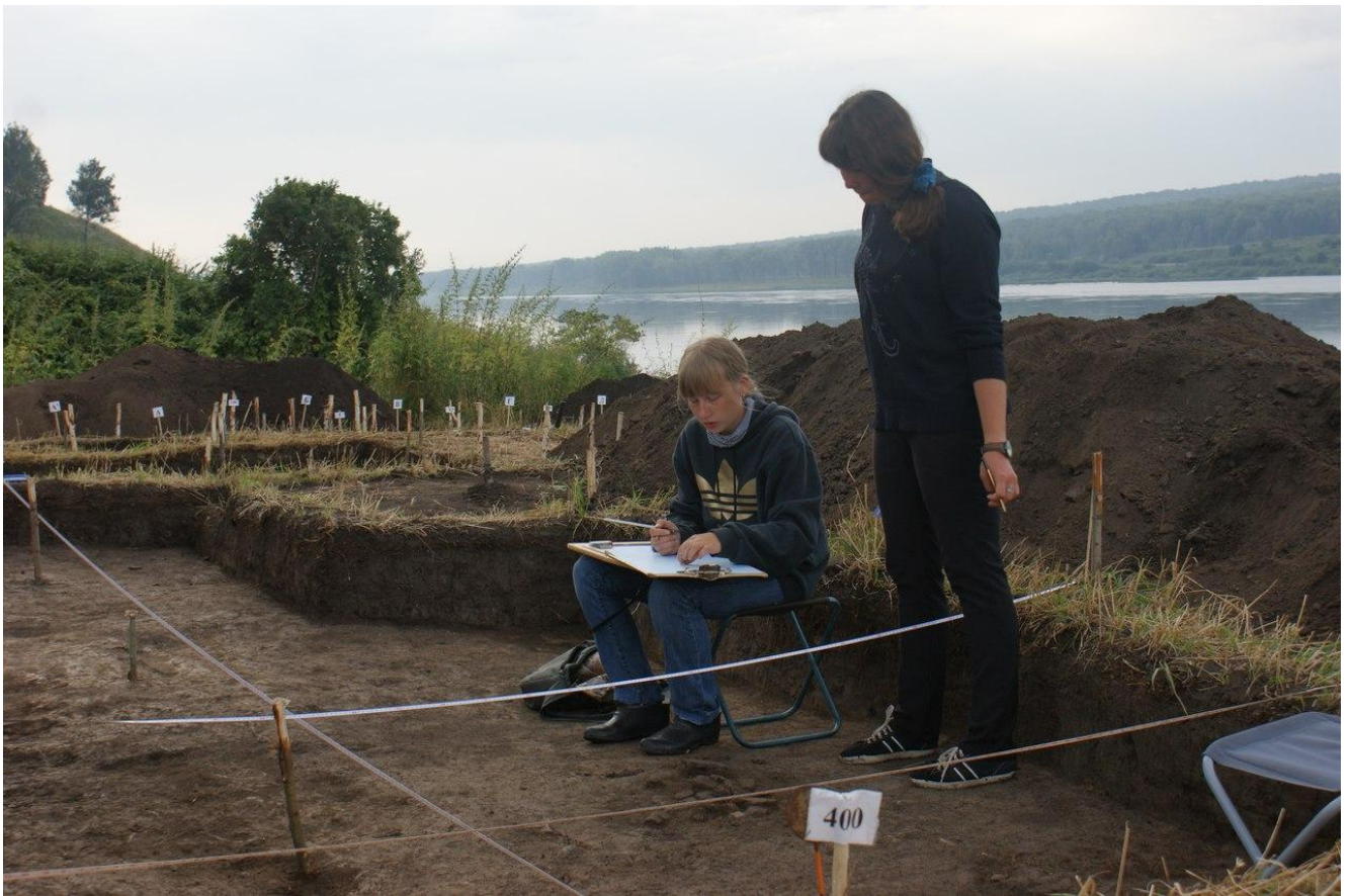
Зарисовка развала керамического сосуда крохалевской культуры